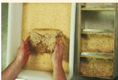
4. Lad dejen hvile i 30 min. Del op i stykker a 1,1 kg, og rul dem i sesamfrø. Lægges i bageforme (helst 18 x 10 x 10 cm). Rasketid: Ca. 60 min.