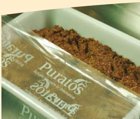
2. Lad blandingen stå natten over (mindst 8 timer) dækket med plastfolie.