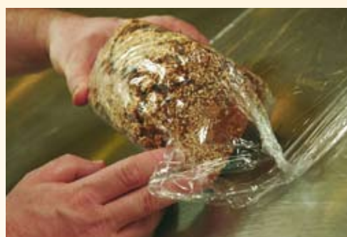
6. Forslag: Straks efter bagning, når brødet stadig er varmt, pakkes det i plastfolie. På den måde kan brødet bevare al sin fugtige friskhed.