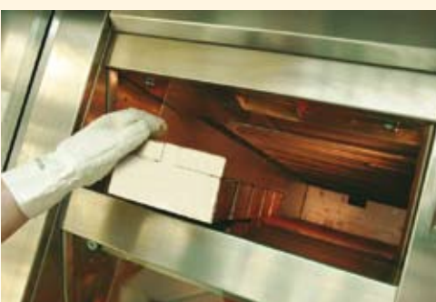
5. Bagevejledning: - Stikovn: fra 280°C til 190°C. - Hærdovn: fra 250°C til 170°C. - Bages i ca. 80 min.