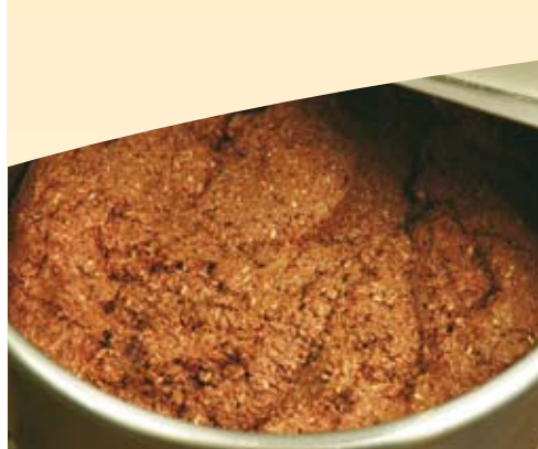
1. Ælt Tegral Kernebrød med varmt vand.