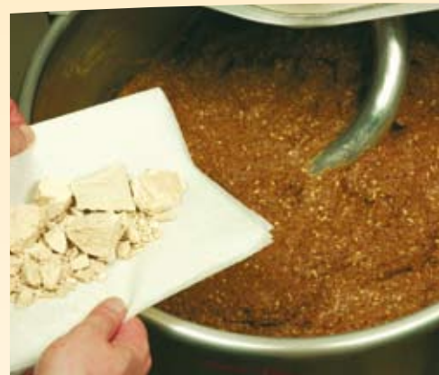
3. Tilsæt gær næste dag, og ælt i 10 min. i 1. gear. Dejtemperatur: 26°C.